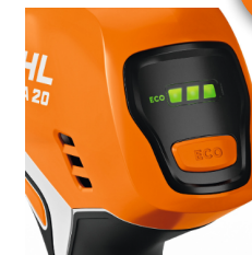
Režim ECO a indikátor úrovne nabitia