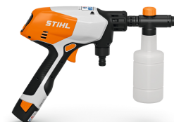
Súprava na rozprašovanie čistiaceho prostriedku