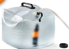
Skladacia nádoba na vodu