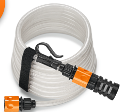
Sacia hadica s filtrom